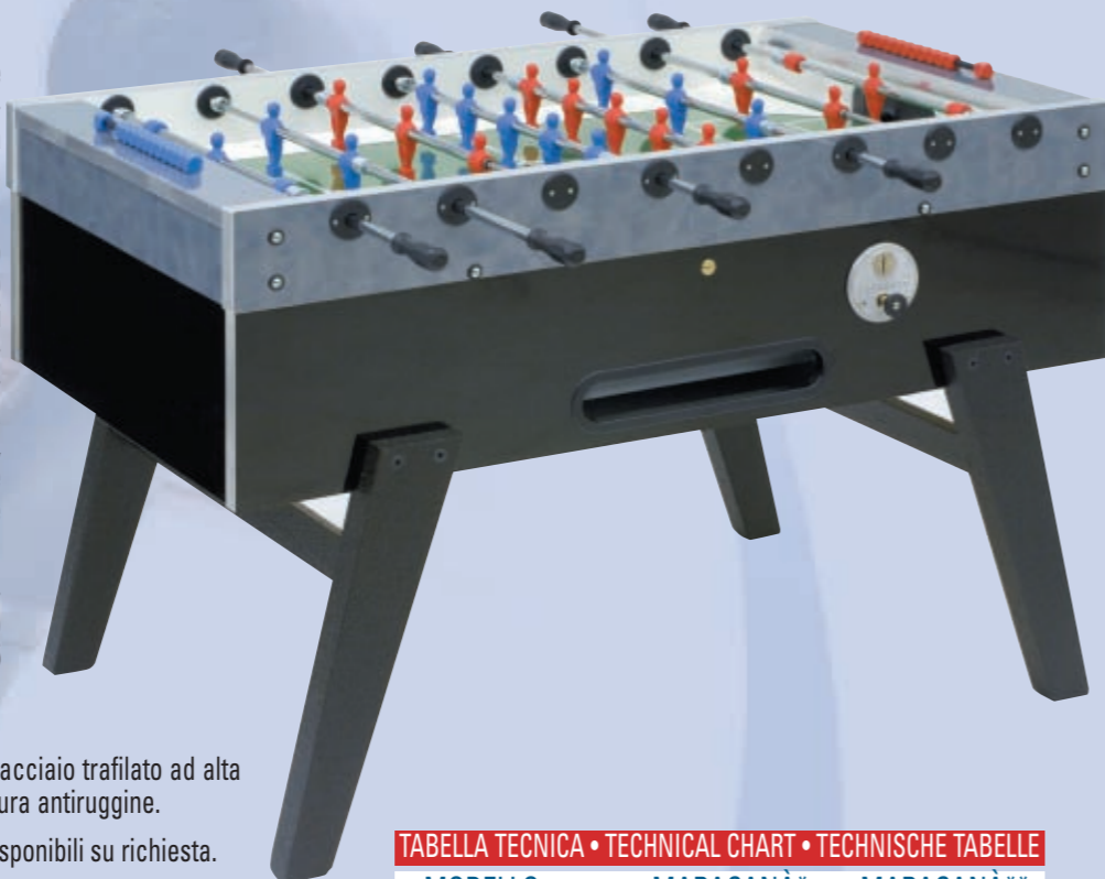
TABELLA TECNICA • TECHNICAL CHART • TECHNISCHE TABELLE

12 10 palline bianche "Standard" in dotazione.